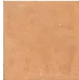
20VPTC0 20x20 Vieux pavés Teinte claire 25 cx/m 2 - 18mm d'épaisseur Code prix unitaire : 52 Code prix m 2 : 110bis