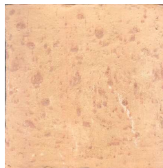
15VPTM0 15x15 Vieux pavés Terre mée 45 cx/m 2 - 18mm d'épaisseur Code prix unitaire : 37 Code prix m 2 : 110ter