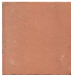
15VP00 15x15 Vieux pavés Teinte naturelle 45 cx/m 2 - 18mm d'épaisseur Code prix unitaire : 27 Code prix m 2 : 102bis