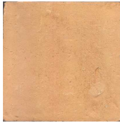
15VPTC0 15x15 Vieux pavés Teinte claire 45 cx/m 2 - 18mm d'épaisseur Code prix unitaire : 30 Code prix m 2 : 104bis