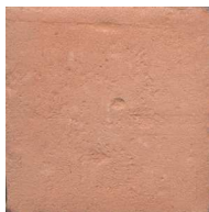
10VP00 10x10 Vieux pavés Teinte naturelle 100 cx/m 2 - 18mm d'épaisseur Code prix unitaire : 8 Code prix m 2 : 107bis