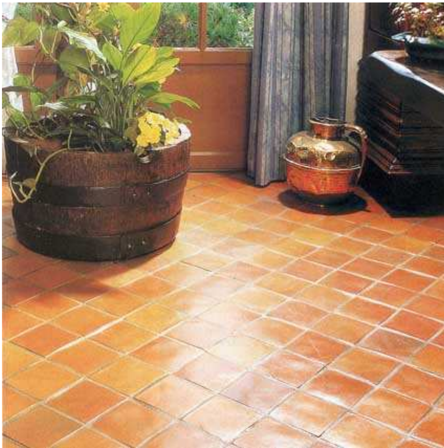
Particulier - Gamme Fait Main en 13x13 cm - teinte naturelle