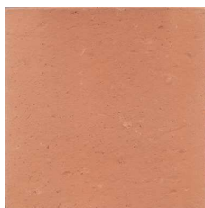
13M00 13x13 fait main Teinte naturelle 54 cx/m 2 - 9mm d'épaisseur Code prix unitaire : 14 Code prix m 2 : 96bis