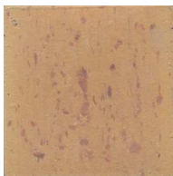
10MTC0 10x10 fait main Teinte claire 91 cx/m 2 - 9mm d'épaisseur Code prix unitaire : 5 Code prix m 2 : 101bis