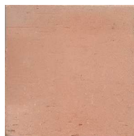
10M00 10x10 fait main Teinte naturelle 91 cx/m 2 - 9mm d'épaisseur Code prix unitaire : 4 Code prix m 2 : 97ter