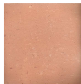
20M00 20x20 fait main Teinte naturelle 24 cx/m 2 - 14mm d'épaisseur Code prix unitaire : 47 Code prix m 2 : 100bis