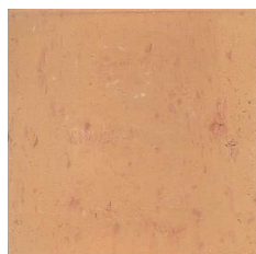
13MTC0 13x13 fait main Teinte claire 54 cx/m 2 - 9mm d'épaisseur Code prix unitaire : 16 Code prix m 2 : 97bis